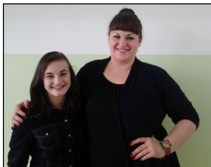
Eva in Aleksandra

Opazila je, da je notranjost šole definitivno drugačna kot v njenih letih. Saj so v njenih letih imeli stare mize in ni bilo toliko barvito pa tudi niso imeli tako sodobnih projektorjev. "Ampak zavese so verjetno še vedno iste," je povedala v smehu.